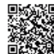
大正大震災双六の解説

大正大震災双六は、大正12年9月1日午前11時58分に起こった大正（関東）大地震の惨状を描いた絵双六です。大正13年頃の発行で、案は月の屋、画は山村耕花です。「災害」の備えチェックリストは首相官邸のホームページにアップされています。“いつかより 今がその時 地震の備え”は、東京消防庁の平成16～17年度の防災標語です。防災双六として活用いただければ幸いです。