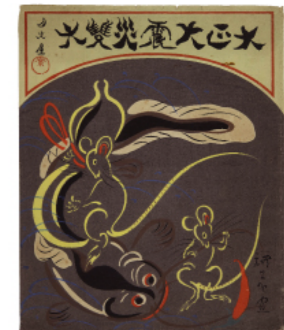
ナマズとネズミの袋絵

大正大震災双六は、大正12年9月1日午前11時58分に起こった大正（関東）大地震の惨状を描いた絵双六です。大正13年頃の発行で、案は月の屋、画は山村耕花です。「災害」の備えチェックリストは首相官邸のホームページにアップされています。“いつかより 今がその時 地震の備え”は、東京消防庁の平成16～17年度の防災標語です。防災双六として活用いただければ幸いです。